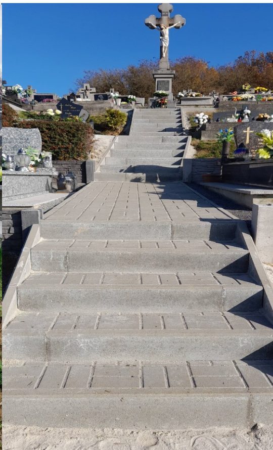
Schody ku križu po rekonštrukcii