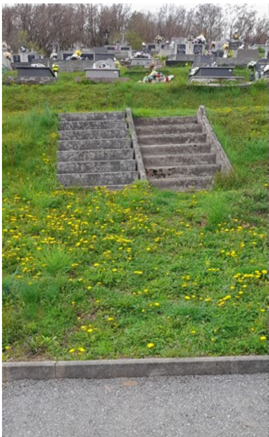
Hlavný vstup pred rekonštrukciou