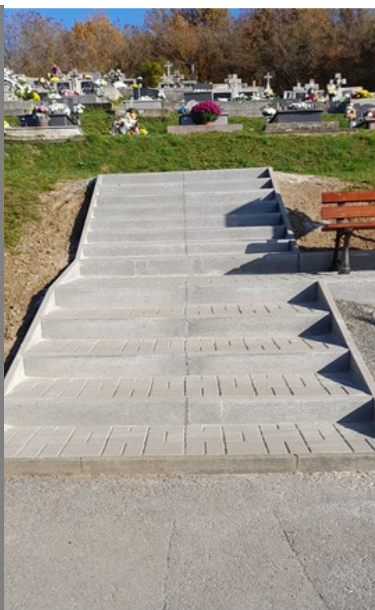
Nové schody po rekonštrukcii